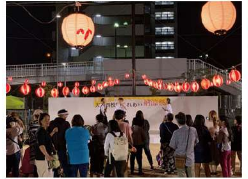
昨年度の納涼祭の様子▶

2020年度は、新型コロナウイルスの影響により例年開催していた納涼祭や防災訓練などまちづくり協議会の取り組みを実施することが出来ていません。新型コロナウイルス感染の状況を見て、感染予防をしっかりと行ったうえで、なにか地域のみなさまと楽しめる取り組みを実施できるよう考えていますので、改めてお知らせをいたします。「こんなことがしたい」、「あんなことをやっているのを見た」など取り組みのヒントになる情報があれば、ぜひ事務局までお知らせください(^_^)/